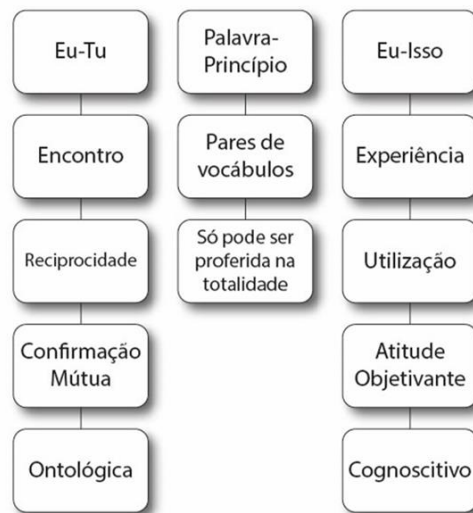
Figura 1 - Palavras-princípio em Martin Buber - Fonte: (OLIVEIRA, 2020, p. 46, adaptação gráfica dos autores)