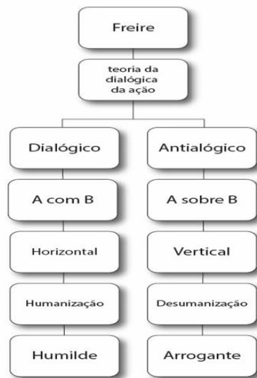
Figura 2 - Teoria da dialogicidade em Paulo Freire - Fonte: (OLIVEIRA, 2020, p. 48, adaptação gráfica dos autores).

Seguindo a mesma linha provocativa, Paulo Freire, em seu clássico texto “Extensão ou Comunicação?” (1998) exemplifica o debate trazendo a figura do agrônomo. O educador agrário que em sua prática de estudos e cuidados com a terra, muitas vezes desconsidera os saberes prévios dos camponeses, que apesar de afastados das técnicas academicamente tidas como corretas, possuem a vivência do espaço estudado. Freire conceitua extensão como “estender um ‘conhecimento’ elaborado aos que ainda não o tem, matando, deste modo, nestes, a capacidade crítica para tê-lo.” (FREIRE, 1998, p. 30). A partir desse conceito, provoca a necessidade de entender que na educação para além da extensão, é preciso diálogo. Para o educador é impossível conceber educação sem diálogo, sem troca, ou seja, sem comunicação. Por este caminho, as pessoas ganham significação enquanto pessoas. Outro fluxograma nos ajuda a compreender o pensamento freiriano: