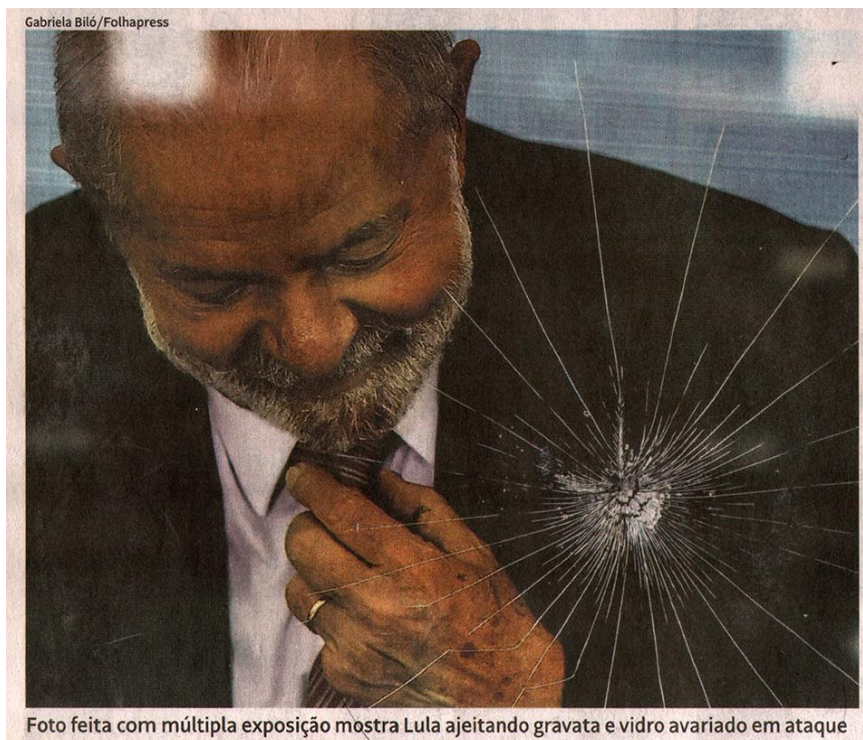
Figura 4. Fotografia, crédito autoral e legenda da capa, jornal Folha de S. Paulo , 19 jan. 2023.