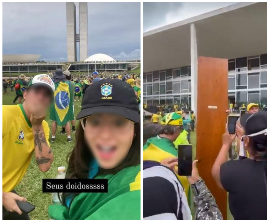
Figuras 3 e 4. Fotogramas de transmissão em live dos atos de vandalismo na sede dos três poderes, 8 de janeiro de 2023.

O choque dos modelos imagéticos com a realidade material foi vivido na pele pelos golpistas. Convictos que estavam do altruísmo dos seus gestos, muitos pareceram não prever as consequências diretas das ondas de depredação que promoveram. Ao invés dos louros de uma vitória santa contra o mal da esquerda no país, os golpistas foram confrontados com a ação imediata da polícia, contradizendo os modelos que os levaram à tentativa de golpe (Figs. 3 e 4). A ação da polícia foi facilitada pela extensa documentação das depredações pelos próprios golpistas, que supunham nessas imagens os espólios de sua vitória.