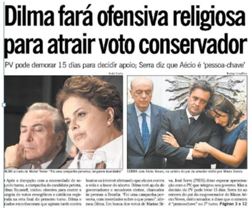
Imagem 1- Capa do jornal O Globo em 05/10/2010

mulher a cada dois dias” (chamada de capa de 10 de outubro); Dilma lançará carta contra aborto e casamento gay (chamada de capa de 14 de outubro).