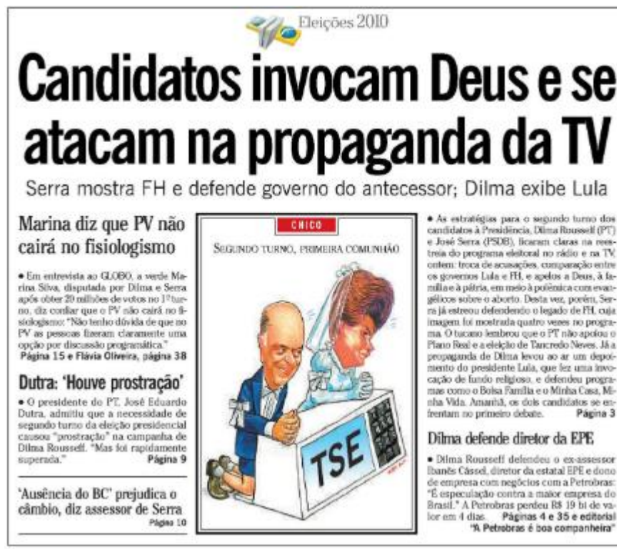
Imagem 2: Capa jornal O Globo em 09/10/2010

A fé e a filiação religiosa dos candidatos também começam a ser exploradas. A manchete de capa de 9 de outubro era: “Candidatos invocam Deus e se atacam na propaganda da TV”. O foco na religião das campanhas continua em evidência, como mostram as matérias: “Programa de Dilma destaca ‘sólida formação religiosa’; o de Serra fala de fé” (14 de outubro); “Santinhos pró-Serra citam Jesus” (16 de outubro).