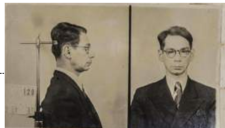
Foto do registro funcional (1937).