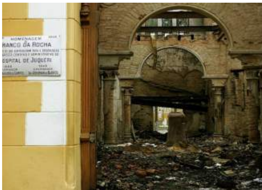
Área do hospital em ruínas após incêndio de 2005

Outra crise que culminou na perda de muitos registros importantes foi o incêndio em dezembro de 2005. Segundo uma pesquisa do Jusbrasil , site especializado em processos judiciais, ex-funcionários afirmam que parte desses documentos perdidos continham o número de mortos no complexo hospitalar, o que passava de 30 mil. Dentro desse número, 2 mil eram menores de idade. Esse incêndio traz dificuldades documentais para provar hoje as questões desumanas que marcaram o Juqueri.