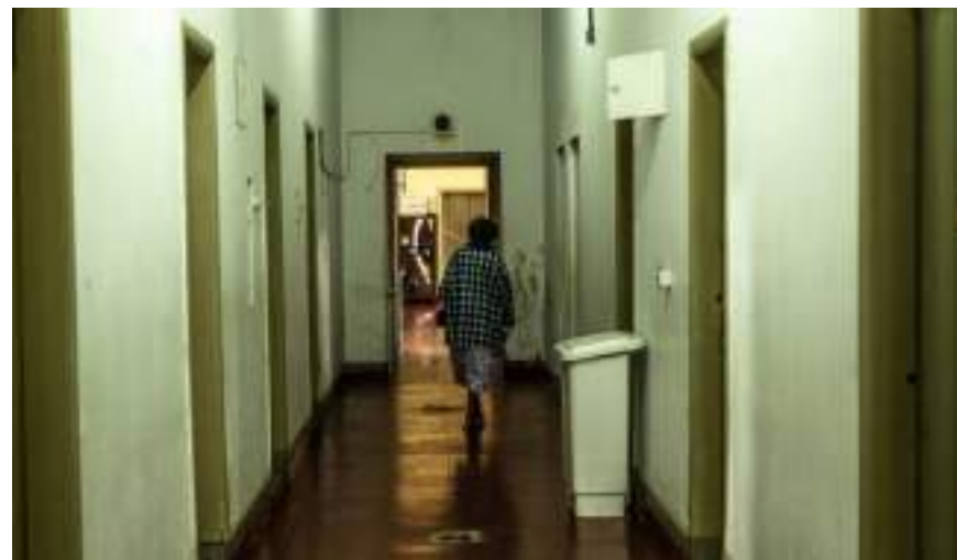
Corredor da ala feminina do Hospital Juqueri Acervo Museu Osório César

Mas, além de não terem a colônia para ir no final do dia como os homens, as mulheres também eram negligenciadas no tratamento psicológico, pois tinham que competir pelo espaço. Quase sempre, elas eram relegadas ao fim da fila. Para a primeira colônia feminina, inicialmente prevista para ter 750 leitos, foi escolhido um terreno em que tivesse iluminação natural e ventilação adequada. Porém, até aquele momento, as mulheres não tiveram muita sorte. A ideia de ter uma iluminação natural era linda, mas afetava nos dias chuvosos e de frio, onde o sol não costumava dar “bom dia”. Sem essa iluminação natural, as mulheres não conseguiam enxergar nada dentro dos leitos. Depois de muitas discussões, foram implantados 14 edifícios mais anexos, que ocuparam uma área de 37 mil metros quadrados, equivalente a cinco campos de futebol, com uma configuração de leque ou um semicírculo.