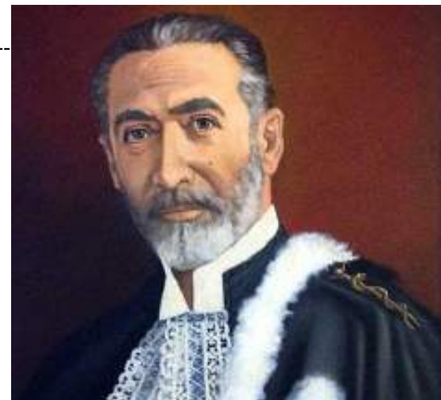
Óleo sobre tela. Acervo Prefeitura de Franco da Rocha

No entanto, as cicatrizes do passado ainda eram visíveis. Gerações de pacientes haviam sofrido sob o regime mais antigo do hospital, e muitos ainda carregavam as marcas desse tratamento desumano. Era uma jornada longa e complexa para curar não apenas as mentes, mas também as feridas da história.