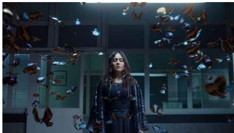
Figura 1 - Cuca invocando mariposas

Agora que compreendemos a base das técnicas por trás dos efeitos visuais, assim como delineamos o cenário global e brasileiro, vamos analisar como parte dos efeitos da série foram concebidos. Ao discutirmos anteriormente a distinção entre efeitos bidimensionais e tridimensionais, é hora de explorar como essas nuances se manifestam na prática.