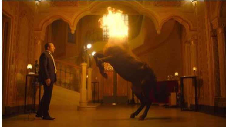
Figura 2 - Mula sem cabeça

necessário passar por diversas etapas de coloração, trabalhando mais com contraste acentuado, até chegarmos à etapa final, onde todos elementos vão estar quase que perfeitamente fundidos na mesma cena, ou pelo menos passar essa impressão.