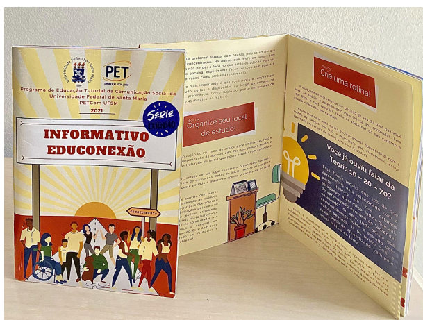
Legenda: primeira edição do Informativo EduConexão

instituições, anteriormente adotada, teve que ser repensado. Desse modo, integrantes do projeto dedicaram-se em desenvolver uma solução que pudesse contribuir positivamente com os estudantes, mesmo com o distanciamento social daquele período. O Informativo EduConexão surge no ano de 2020 com a intenção de sanar a ausência física do projeto nas escolas. Foi lançado inicialmente em formato de livro eletrônico e após uma versão impressa. A primeira edição da cartilha abrange uma variedade de temas relacionados à comunicação, sendo eles: dicas de estudo, Fake News , Representatividade Negra e Uso de filmes na redação do ENEM, contribuindo assim para a formação integral dos estudantes.