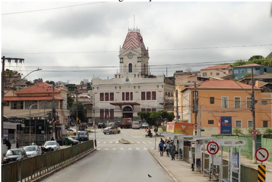
Rua 7 de setembro – 264. Autor: João Pedro.