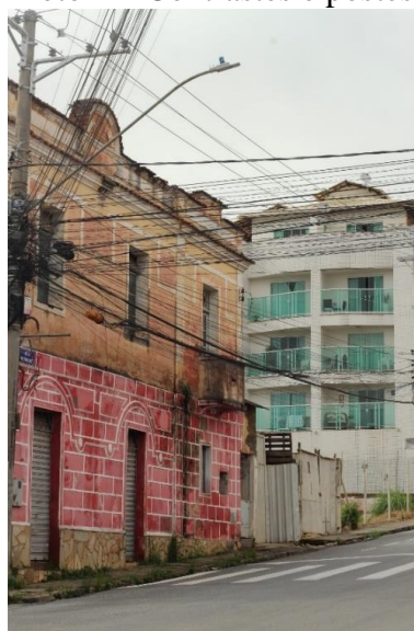
Rua Martinho Campos – 14. Autor: João Pedro.