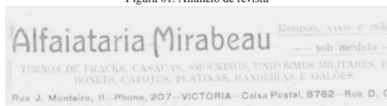
Figura 01: Anúncio de revista

De início, nossa análise parte da observação dos anúncios da revista Vida Capichaba voltados para a moda da época. Na década de 20 podemos notar a grandeza da alfaiataria, como registrados nos anúncios de revista (Figura 01 e Figura 02).