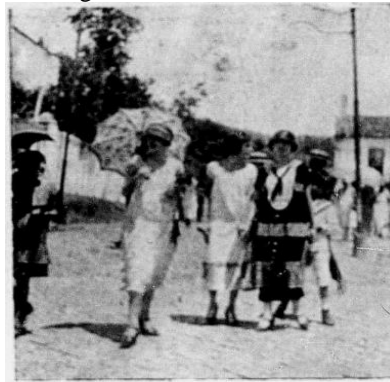
Figura 07: Mulheres na rua

Os calçados femininos também seguem uma tendência nacional, sendo chamados de sapatos de dança, sapatos abertos na lateral e fechados na frente (Figura 07).