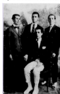
Figura 09: Homens tirando foto