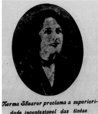
Figura 03: Imagem mulher