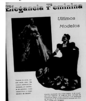
Figura 13: Página de revista com modelos de vestidos