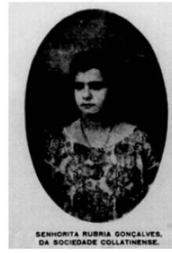
Figura 06: Imagem de mulher