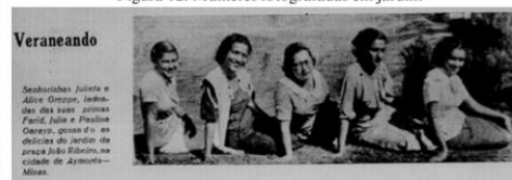
Figura 12: Mulheres fotografadas em jardim