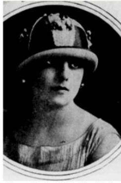
Figura 04: Imagem de mulher