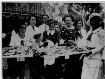
Figura 11: Imagem de mulheres em uma compra

Por fim, os acessórios se destacam por seguir uma tendência de “mais é mais”, com várias golas diferentes, a volta dos chapéus (Figura 11) e a sobreposição, ou terceira peça (Figura 12). Os vestidos da época se tornam maiores, seguindo a tendência nacional, a fim de alongar a silhueta. Além disso, os trabalhos de produção se tornam mais complexos, com mais volume e silhuetas diferenciadas de vestidos (Figura 13).