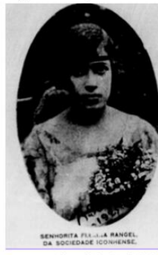
Figura 05: Imagem de mulher