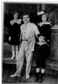
Figura 08: Homem com seus filhos

Já na moda masculina não conseguimos identificar muitas mudanças ao longo das décadas. Os homens sempre usam seus ternos e chapéus, porém os calçados seguem uma tendência nacional: sapatos de bico fino (Figura 08 e Figura 09).