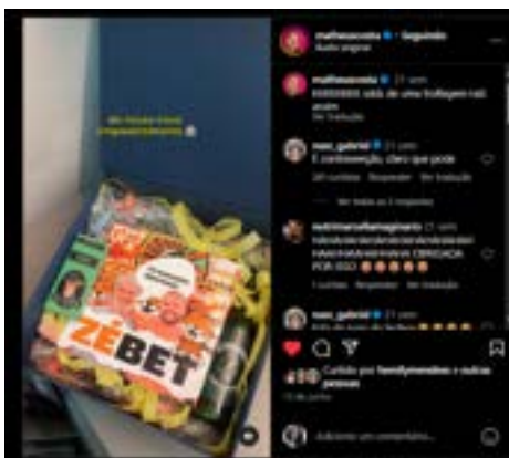
Figura 5 - Vídeo em que o influenciador Matheus Costa simula estar abrindo uma casa de apostas com o nome e a imagem do pai

Matheus Costa, influenciador e publicitário com mais de 3 milhões de seguidores, também se posiciona contra a divulgação de apostas. Em um de seus vídeos, conhecido por trollagens com o pai, ele simulou estar lançando uma casa de apostas online chamada "Zé Bet", usando ironicamente o nome do pai, seu Zé. Ao abrir uma caixa que parecia ser um presente, seu Zé se revolta ao descobrir a falsa associação de sua imagem com um cassino, reforçando a crítica à promoção desse tipo de prática.