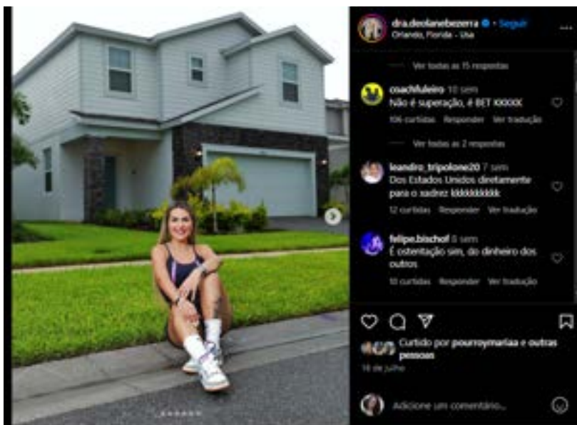
Fonte: Instagram Deolane Bezerra, 2024.

A continuidade da promoção de jogos de azar durante o processo judicial de Deolane levanta questões éticas sobre a responsabilidade dos influenciadores diante de seus seguidores. Como destaca Housel (2024), em um tema tão sensível, envolvendo o embate “emoções versus fatos”, isso é um problema. Porém, esse fator nos ajuda a entender por que nem sempre os indivíduos fazem o que é necessário quando o assunto é dinheiro. A influência digital, nesse contexto, pode ultrapassar limites legais e éticos ao legitimar práticas prejudiciais, como os jogos de azar.