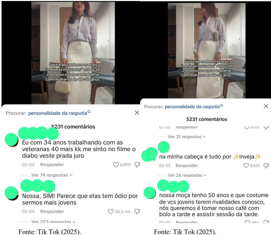
Figuras 2 e 3 – Imagens dos comentários

Ao observarmos os comentários (Figuras 2 e 3), as seguidoras complementam a afirmação do vídeo afirmando que mulheres de 40 a 50 anos agiriam inadequadamente com mulheres mais jovens devido ao ódio ou inveja da juventude que estas possuem.