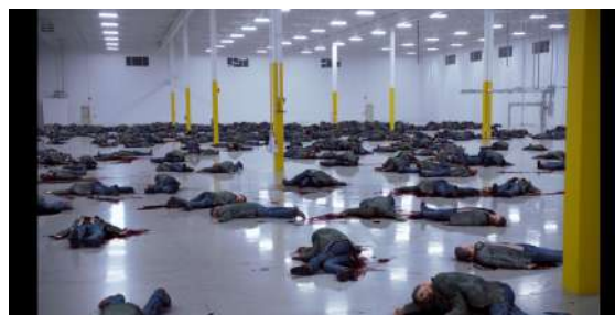
Figura 1 – Clones de Dean mortos por Castiel

Naomi, que comandava o Céu, aparece, satisfeita, e declara que Castiel está pronto. A câmera abre o plano, e por todo o galpão há vários clones de Dean, todos mortos pelo anjo (Figura 1). Naomi, além de lavar seu cérebro, o preparou para ser capaz de aniquilar o caçador sem hesitação, e quando considera que ele está totalmente apto, o manda localizar e recuperar a placa dos anjos – objeto escrito por Metatron, escriba de Deus, com todas as informações possíveis sobre os seres do Céu.