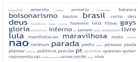
Figura 03: Nuvem de palavras dos comentários do segundo vídeo

O segundo vídeo com título “Gloria Groove agita o público da Paulista em show na Parada LGBTQ+ de SP” mostrou que dos 59 comentários, 18 apresentaram teor preconceituoso, transfóbico, religioso e faziam referência à política conservadora, sendo que os demais comentários demonstravam reverência à artista. A nuvem de palavras pode ser observada na figura 03.