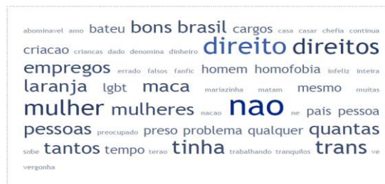
Figura 02: Nuvem de palavras dos comentários do primeiro vídeo

Assim, foram analisados os clusters formados na rede (figura 01), a saber: no primeiro cluster (cor lilás), a maioria dos comentários dos vídeos é contra o evento, além de utilizarem termos homofóbicos, preconceituosos, e de cunho religioso; no segundo cluster (cor verde), os comentários se dividem entre os usuários que estão a favor e contra o movimento LGBTQIAP+, fomentando mais debate; e no terceiro cluster (cor laranja) formado na rede, a maioria dos vídeos possui comentários favoráveis ao movimento LGBTQIAP+ e parabenizando a Parada LGBTQ+ de SP. Posteriormente, foram selecionados os dois vídeos mais relevantes para aplicá-los no módulo da plataforma acima mencionada Video Comments para elaborar uma análise sobre os termos mais utilizados pelos usuários. O primeiro vídeo intitulado “A gente está aqui em busca dos nossos direitos”, diz Pablo Vittar sobre Parada LGBTQ+ de SP”, mostrou que dos 34 comentários, doze se tratava de frases transfóbicas e contrárias à luta pelos direitos da comunidade. A partir dos comentários, foi elaborada uma nuvem de palavras com os termos mais utilizados (figura 02).