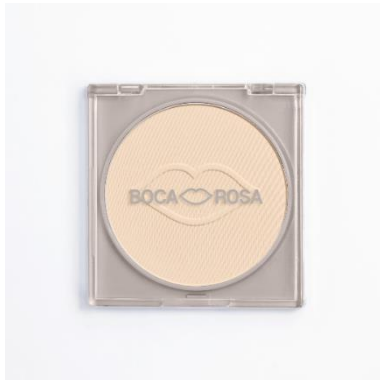
Figura 1: Embalagem de pó compacto (Boca Rosa Beauty, 2024)