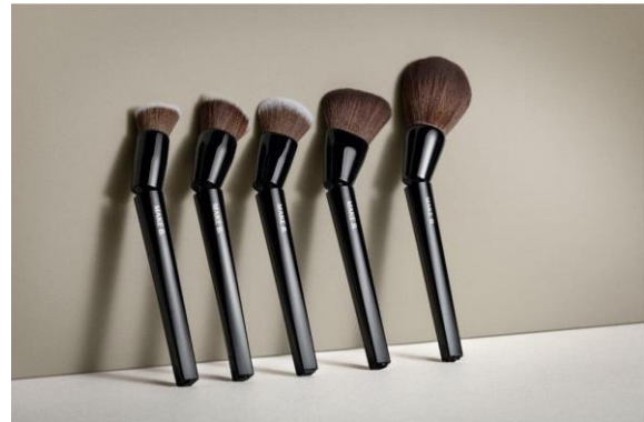
Figura 2: Pincéis articulados (Oboticário, 2024)