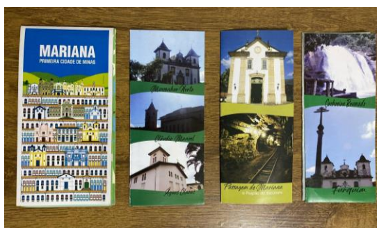
Fig. 1 – Folders disponíveis na Central de Atenção ao Turista

A fim de qualificar as características dos imaginários construídos a partir desses materiais gráficos, coletamos as publicações em meados de agosto de 2024 a fim de investigá-las. Encontramos panfletos que se assemelham pelo formato gráfico em folder com o qual se elaboram narrativas sobre a cidade e que se distinguem em torno dos elementos que estruturam o projeto gráfico. Nesse último aspecto, podemos notar à primeira vista que esses materiais se diferenciam por duas composições distintas: uma elaborada como um guia turístico sobre o Centro Histórico e outra ilustrativa dos distritos Cachoeira do Brumado, Furquim, Monsenhor Horta, Cláudio Manoel e Águas Claras.