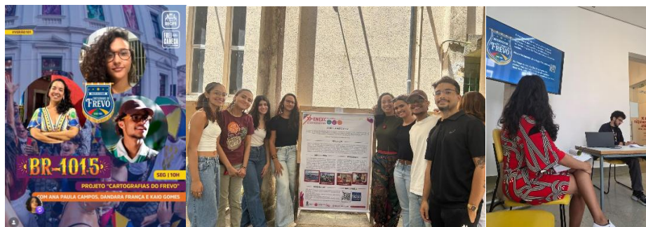
Figura 3 – Desdobramentos do projeto Cartografias do Frevo em mídia, evento acadêmico e ações extensionistas.

Para a universidade, o projeto ampliou sua presença pública em espaços culturais e midiáticos. Para entrevistados e agentes culturais, criou registros e canais de visibilidade. Para a sociedade, disponibilizou conteúdos qualificados sobre o frevo em linguagem acessível.