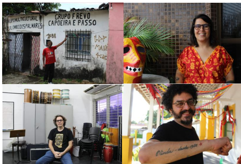
Figura 2 – Alguns dos entrevistados da série Cartografias do Frevo (2025).